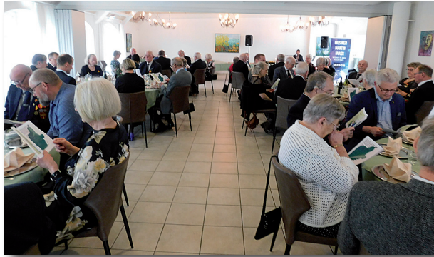
fællessangen "Blæsten går frisk over Limfjordens vande"

Det hele anrettet som buffet med høflig selvbetjening. Det gik ganske gelinde, og snart summede snakken hyggeligt hen over bordene, medens man nød den gode mad.