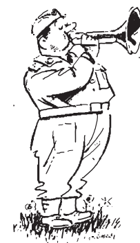
Menig 66 blæser honnør