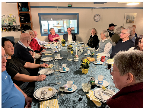
Hygge ved bordene

flødeboller rundt, som man kunne nyde som dessert.