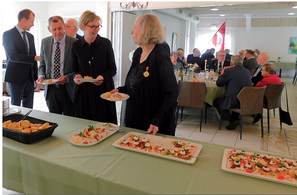
Buffet med høflig selvbetjening

Det hele anrettet som buffet med høflig selvbetjening. Det gik ganske gelinde, og snart summede snakken hyggeligt hen over bordene, medens man nød den gode mad.