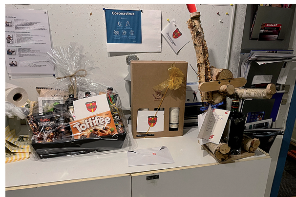
Flotte gaver til Morten

De, der i henhold til invitationen mødte op klokken 17.30, kunne konstatere,