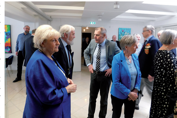
Man sludrede hyggeligt sammen i hotellet foyer inden middagen

nuen bestod af forret - varmrøget laks og hønsesalat; hovedret - kalvesteg og glaseret skinke med små kartofler, sauce, flødekartofler, grøntsager og salat; brød og smør; dessert - islagkage. Hertil vin, øl og vand ad libitum, og efter middagen blev der budt på kaffe/te og småkager.